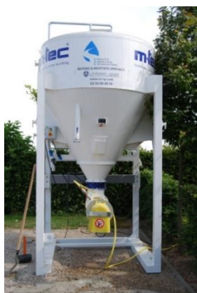
Minimix 3 m 3