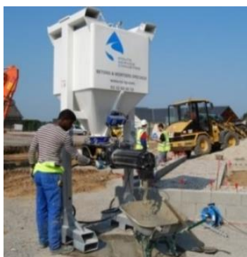
Minimix 1.2 m 3