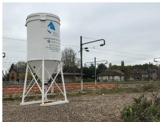
Silo à vrac 19 m 3