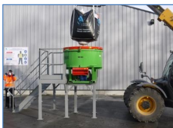
MINI-CENTRALE À BÉTON