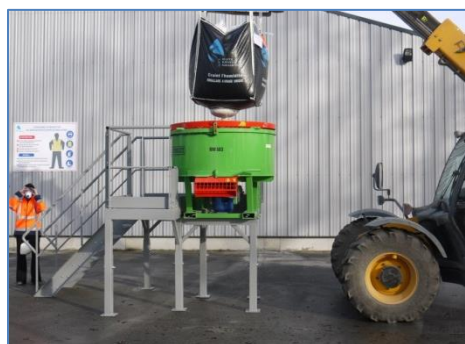
MINI-CENTRALE À BÉTON